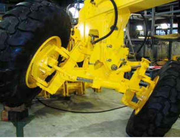
Ayarlanabilir ön aks açısı.

Ayarlanabilen kumanda masası sayesinde geniş görüş imkanı. İsteğe bağlı olarak NAIS kumanda masası veya Joystick kumanda masası.