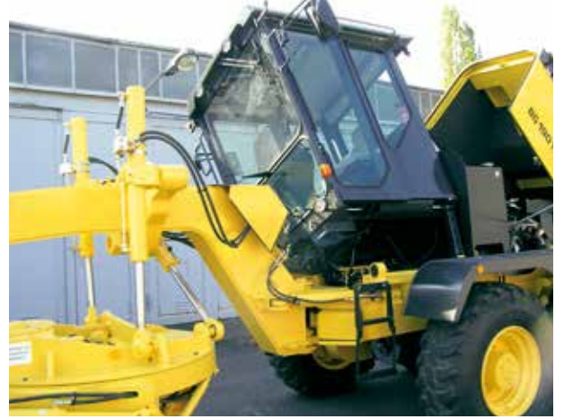
Devrilebilir kabin ile kolay bakım imkanı.