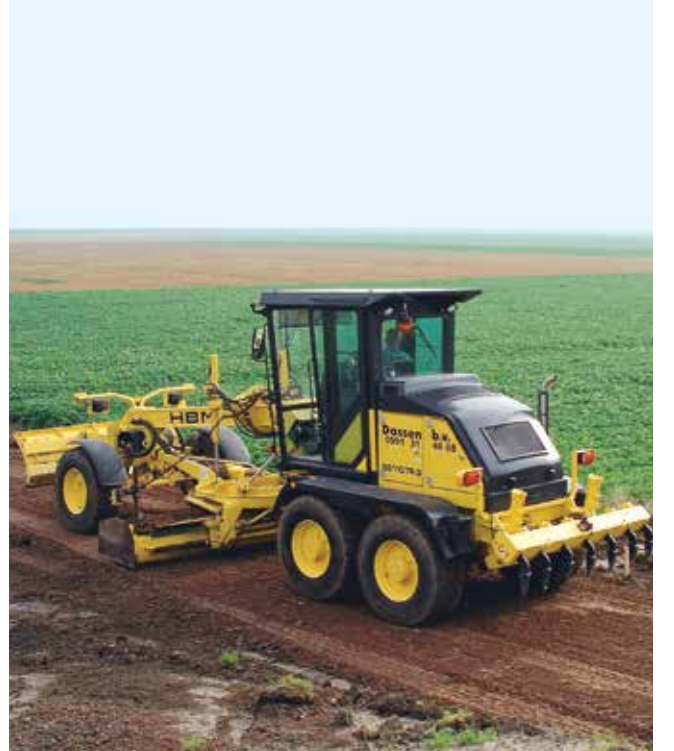
Küçük ve orta şantiyeler için uygun BG 110 TA-4, kompakt Tandem-Greyderi

İhtiyacınıza en uygun seçenekler ile geniş ürün yelpazesi kullanımınıza sunulmaktadır. Arazi şartlarına göre seçebileceğiniz tandem veya tüm tekerleklerden çekişli (6x6) modeller ürün gamı içerisinde yer almaktadır. BG 70 ve BG 110 modelleri şehir içi kullanımları, spor kompleksi yapımları ve dar alan inşası için uygun seçeneklerdir. BG 130 ve BG 160 modelleri ağırlıklı olarak yol yapımında kullanılan greyderlerdir. BG 190 ve BG 240 modelleri otoyol, hava alanı inşaatı, maden işletmeleri için yer altı ve yer üstü uygulamalarında etkin kullanım imkanı sunmaktadır. Ürün gamımıza yeni eklenen ve sadece 1.80 metre yüksekliğe sahip Yer Altı Greyderi BG 110-M ufak boyutları ile tüm maden ocaklarında kullanıma sunulmuştur. Özetle HBM greyderleri tüm zorlu koşullara uygun seçenekler ile hizmetinizdedir.